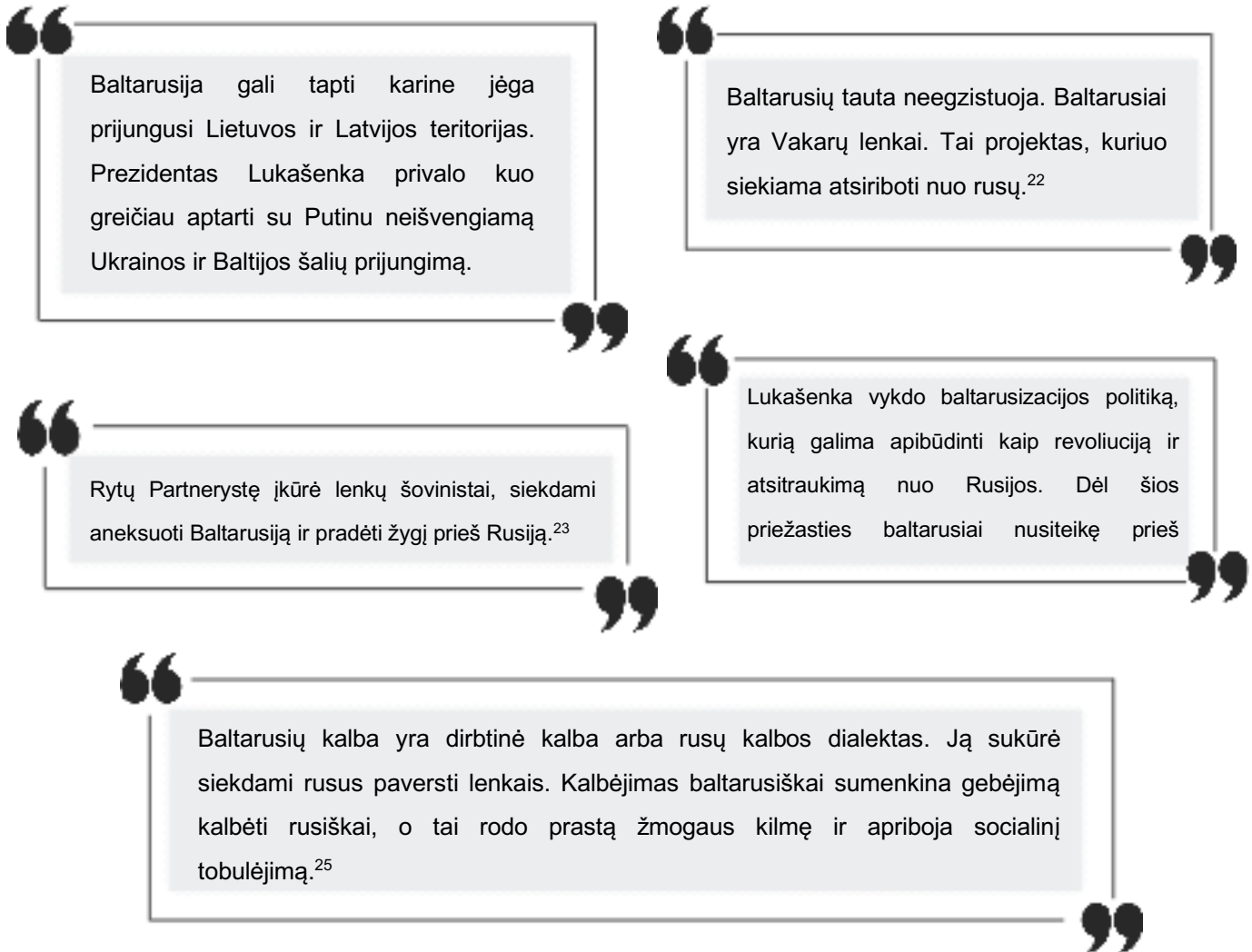
Iliustracija Nr. 1. Agresyvosios informacijos pavyzdžiai Baltarusijoje

Neretai pasitaiko straipsnių, kuriuose atvirai kvestionuojamas Baltarusijos suverenumas ir teritorinis vientisumas. Panašiuose straipsniuose Baltarusijos politika apibrėžiama kaip nacionalistinė ir antirusiška, neretai iškraipoma ir manipuluojama faktais. Žemiau pateikiamas pareiškimų apie Baltarusiją Rusijos žiniasklaidos priemonėse sąrašas („Regnum“ ir „EADaily“, 2016 m. rugpjūtis – lapkritis):