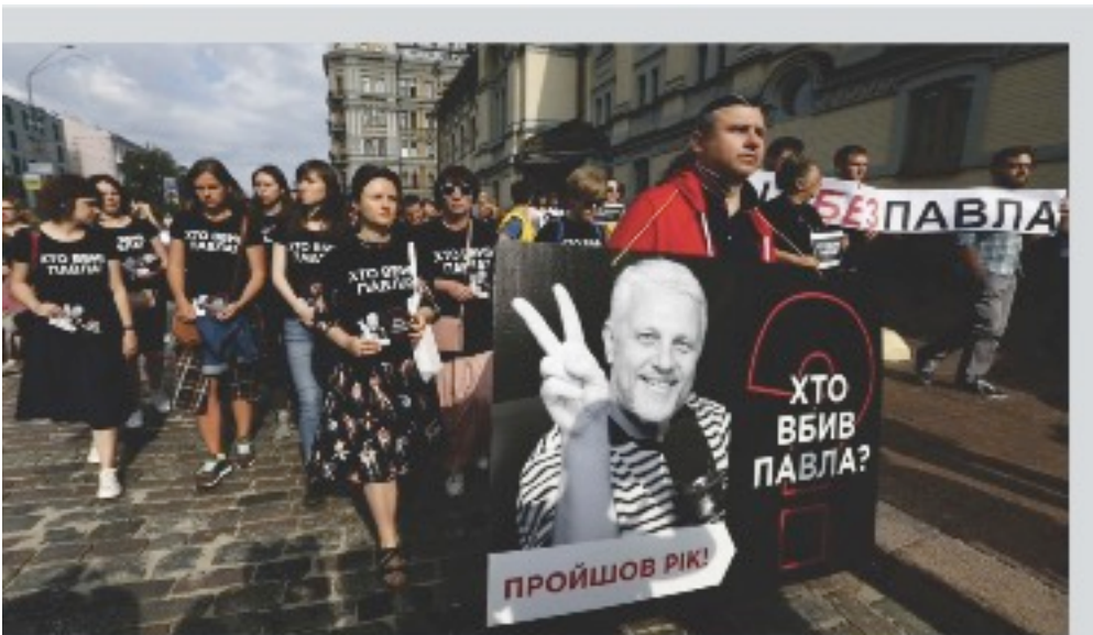
Nuotrauka Nr. 2. Protestai dėl tiriamosios žurnalistikos atstovo Pavlo Šeremet nužudymo

visiškai nepasitikėjo. 2017 metų pabaigoje Tarptautinė žurnalistų federacija paskelbė, kad žurnalistai Ukrainoje negali jaustis saugūs, nes nusikaltimai prieš juos dažniausiai nėra baudžiami ir išaiškinami. 27